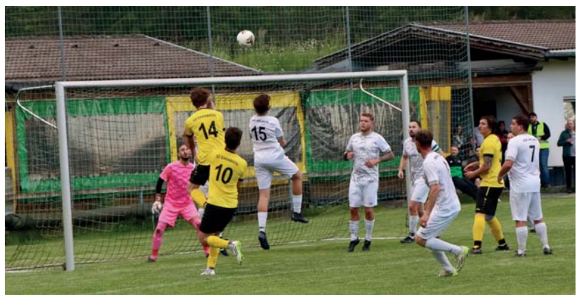
Luftduell im Meisterschaftsspiel gegen die SBF Pflach

Diesen Schwung gilt es für die neue Saison Mitte August mitzunehmen. Doch zuerst geht es in die wohlverdiente Sommerpause, bevor Mitte Juli der Trainingsauftakt beginnt.