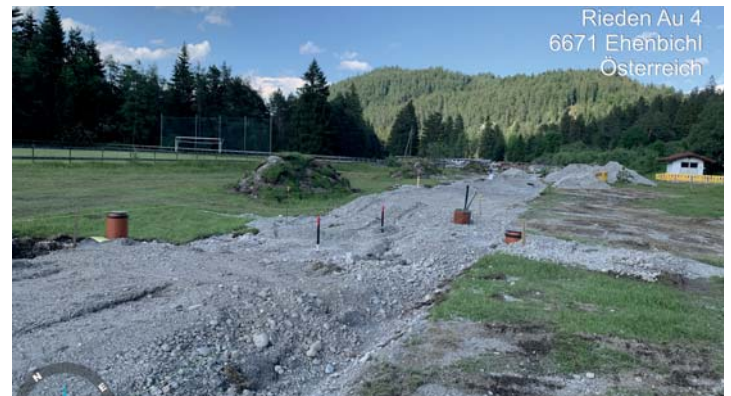
Rieden Au 4 6671 Ehenbichl Österreich

Sozusagen in Vorleistung ist die Gemeinde Ehenbichl bei der Realisierung von "leistbarem Wohnen" bereits im Ortsteil Rieden gegangen. In einer Bauzeit von drei Monaten konnten die Erschließungsarbeiten im Bereich des neuen Baugebietes nahe dem Fußballplatz abgeschlossen werden. Die Grundstücke wurden parzelliert und mit allen notwendigen Versorgungs- leitungen (Wasser, Kanal, Strom, Glasfaser etc.) sowie einer neuen Zufahrtsstraße erschlossen. Gleichzeitig wurden kleinere Sanierungen bei der bestehenden Dorfstraße vorgenommen.