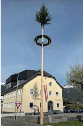
Maibaum in Ehenbichl

Die Löschgruppe Rieden hielt außerdem eine Maibaumwache mit Tombola ab, wobei das Kulinarische nicht zu kurz kam.