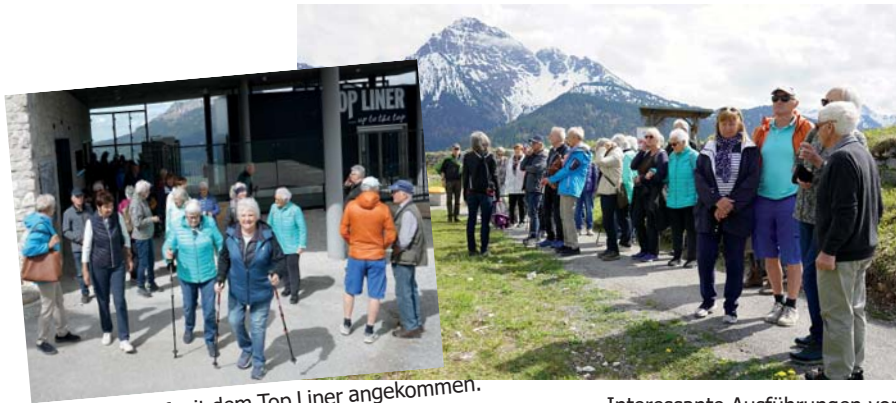
Am Schlosskopf mit dem Top Liner angekommen.