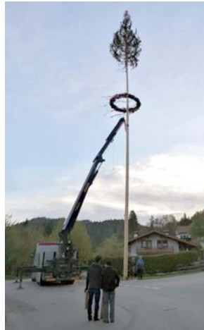
Maibaum in Rieden

Traditionell wurden von der FF Ehenbichl und der SLG Rieden auf den Dorfplätzen Maibäume aufgestellt.